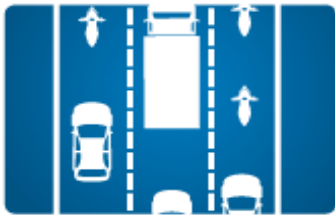
DIE RETTUNGSGASSE AUF MEHREREN SPUREN